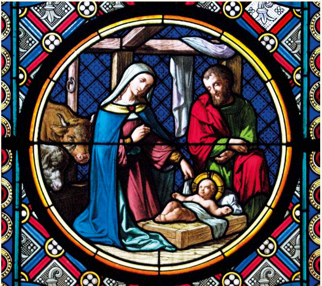
Geburt Christi, Glasfenster (19. Jhdt.) im Chor des Münsters zu Basel