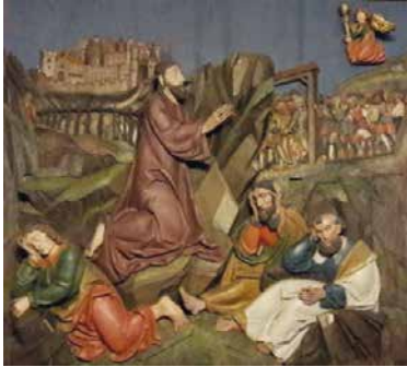
Jesus im Ölgarten Liebfrauenkapelle Rapperswil SG

Am Donnerstag, 14. April 2022 , feiern wir den Hohen Donnerstag. An diesem Tag gedenken wir des Letzten Abendmahles Jesu mit den zwölf Aposteln am Vorabend seiner Passion und Kreuzigung. Mit der Abendmesse um 19.30 Uhr beginnen die drei österlichen Tage – Karfreitag, Karsamstag und Ostersonntag.