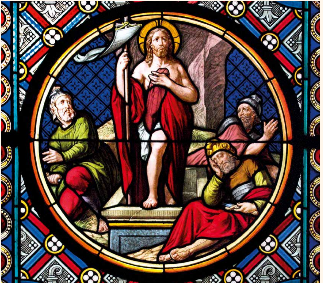
Auferstehung Christi, (19. Jhdt.) im Chor des Münsters zu Basel