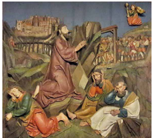
Jesus im Ölgarten Liebfrauenkapelle Rapperswil SG